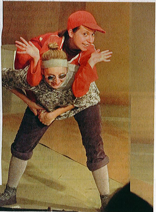
Das Akademietheater Ulm zeigt am Dienstag, 3. Mai, um 15 und 20 Uhr Wolfgang Mennels Stück „Rot Blau Schwarz Grau“ im Mittelschwäbischen Heimatmuseum Krumbach.